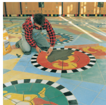
Mit PCI Flexmörtel und PCI Flexmörtel-Schnell können Fliesen und Platten sicher verlegt werden.